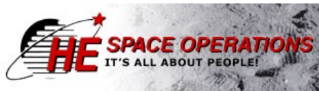
HE Space Operations