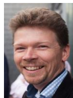
Ton Marée Bestuurslid